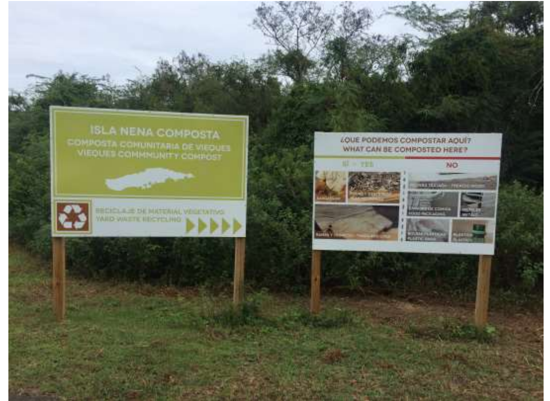
Desarrollo de área de compostaje en Vieques