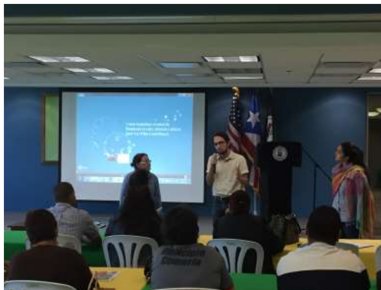
Presentación guía: "Cómo organizar limpiezas en playas, ríos y charcas"