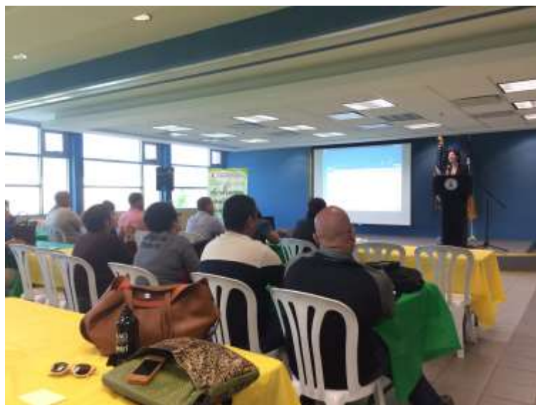
Reunión CCOREM 9/9/2015