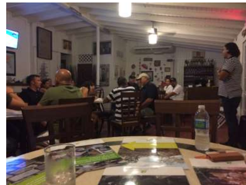
Reunión con comerciantes de La Parguera, Lajas. Junto a Programa Reciclaje Municipio de Lajas, y A.D.A 8/9/2016