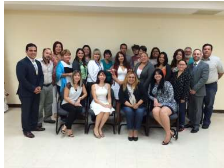
2do Adiestramiento de Promotores de Reciclaje, Autoridad de Desperdicios Sólidos, Junta de Calidad Ambiental. Coordinado por Equipo Educación PRRP 3/7/16