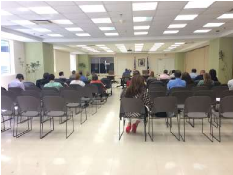
Participación en Vistas Públicas sobre Reglamento Compostaje Junta de Calidad Ambiental 12/3/15