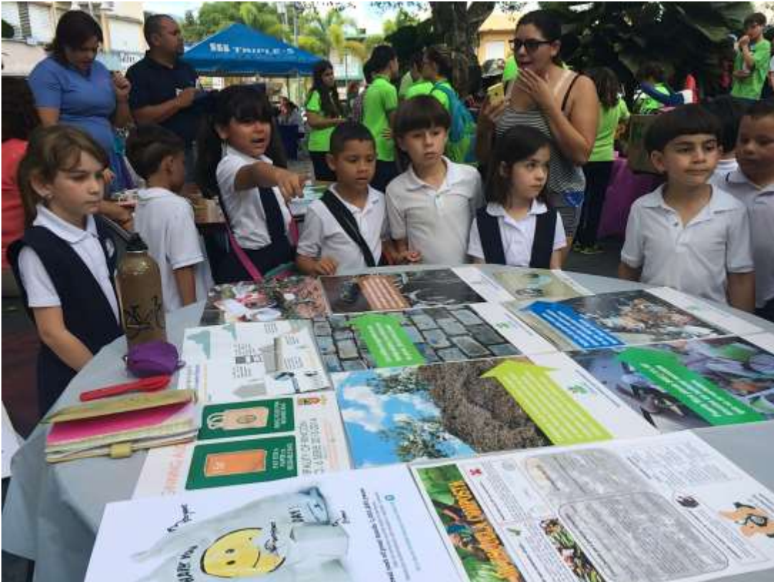
Feria de Reciclaje, Municipio de Utuado, 3/31/16